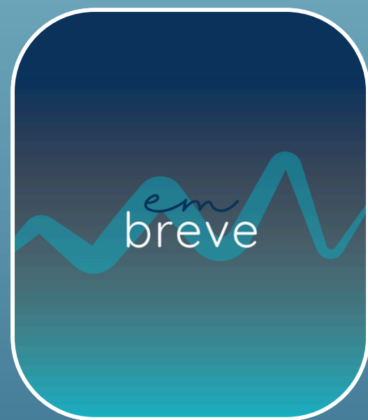
em breve em breve